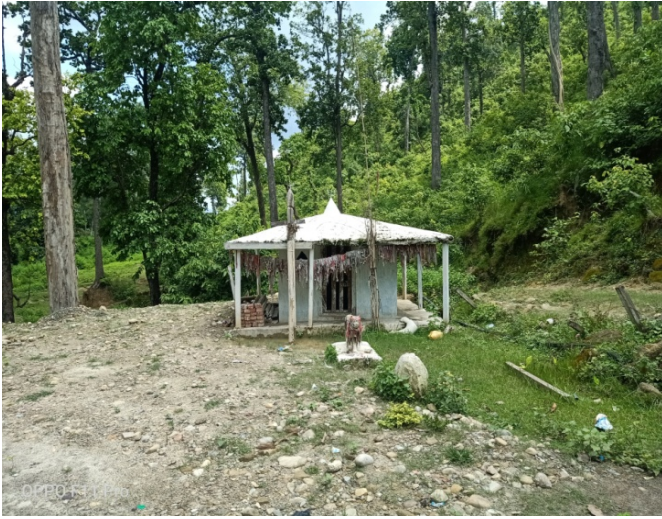
गंगामाला देउती बज्यै मन्दिर